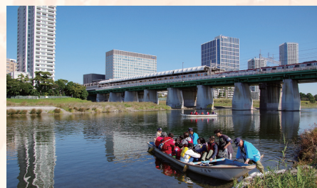
※写真は平成28年度二子の渡し体験の様子