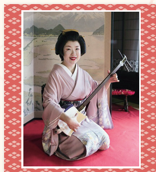
日本舞踊 品川大井海岸芸者衆